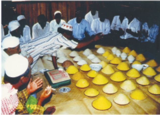
Gambar 1: Ritual Mag-paiibahau (kiri) dan Pagkanduli, Sitangkai, Filipina