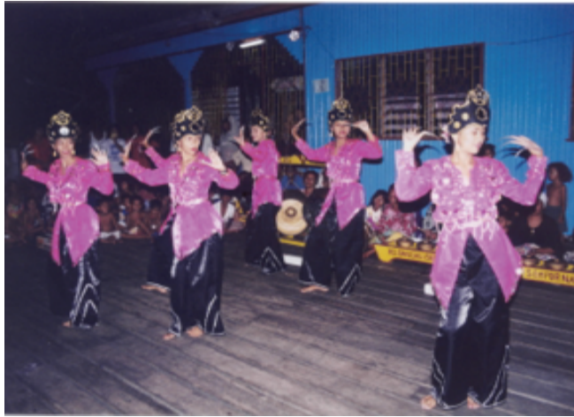
Gambar 3: Igal Limbayan yang ditarikan oleh generasi muda Bajau Laut di Semporna