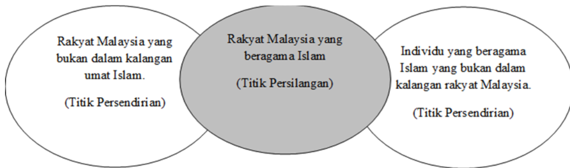
Rajah 2 : Konsep al-'umūm wa al-khuṣūs min wajh

Berdasarkan konsep tersebut, sebahagian ilmuwan nahu menggunakannya sebagai medium untuk menjelaskan hubungan dan perbezaan antara al-kalām 31 dan juga al-kalim 32 yang dibincangkan dalam ilmu nahu. Antara tokoh tersebut ialah Zayn al-Dīn Khālid bin 'Abdullāh al-Azharī (w. 905) menerusi al-Taṣrīh bi Maḍmūn al-Tawḍīh fī al-Nahw yang mana karyanya ini dianggap sebagai salah satu karya tertinggi dan terpenting yang menjadi rujukan dalam ilmu nahu. Al-Azharī berkata: